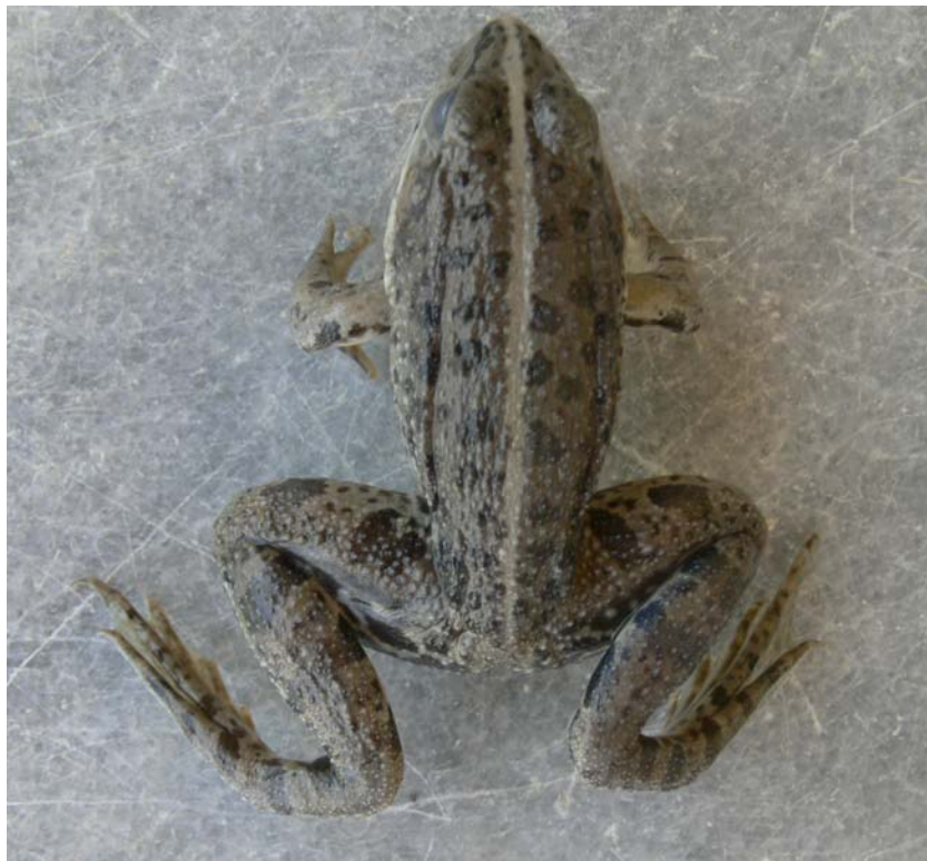
شکل ۴- ریخت سه قورباغه مردابی