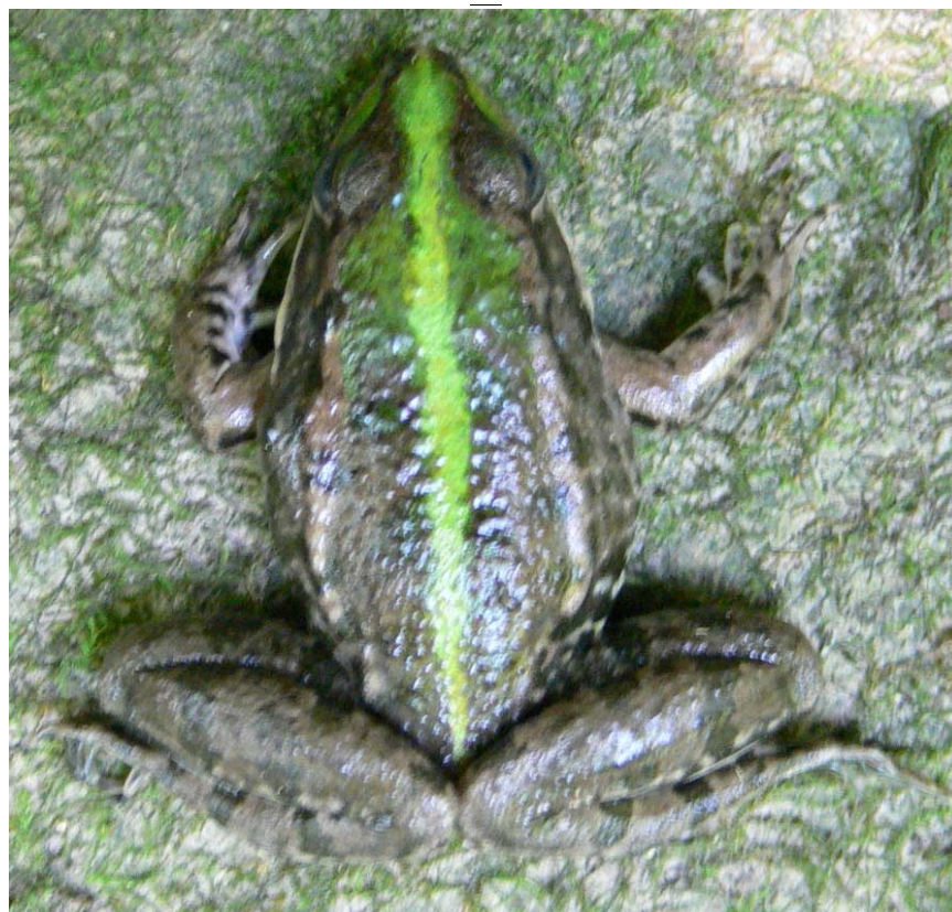
شکل ۵- ریخت چهار قورباغه مردابی