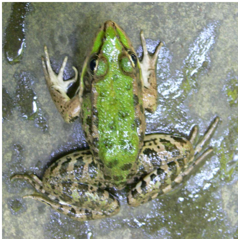
شکل ۶- ریخت پنج قورباغه مردابی