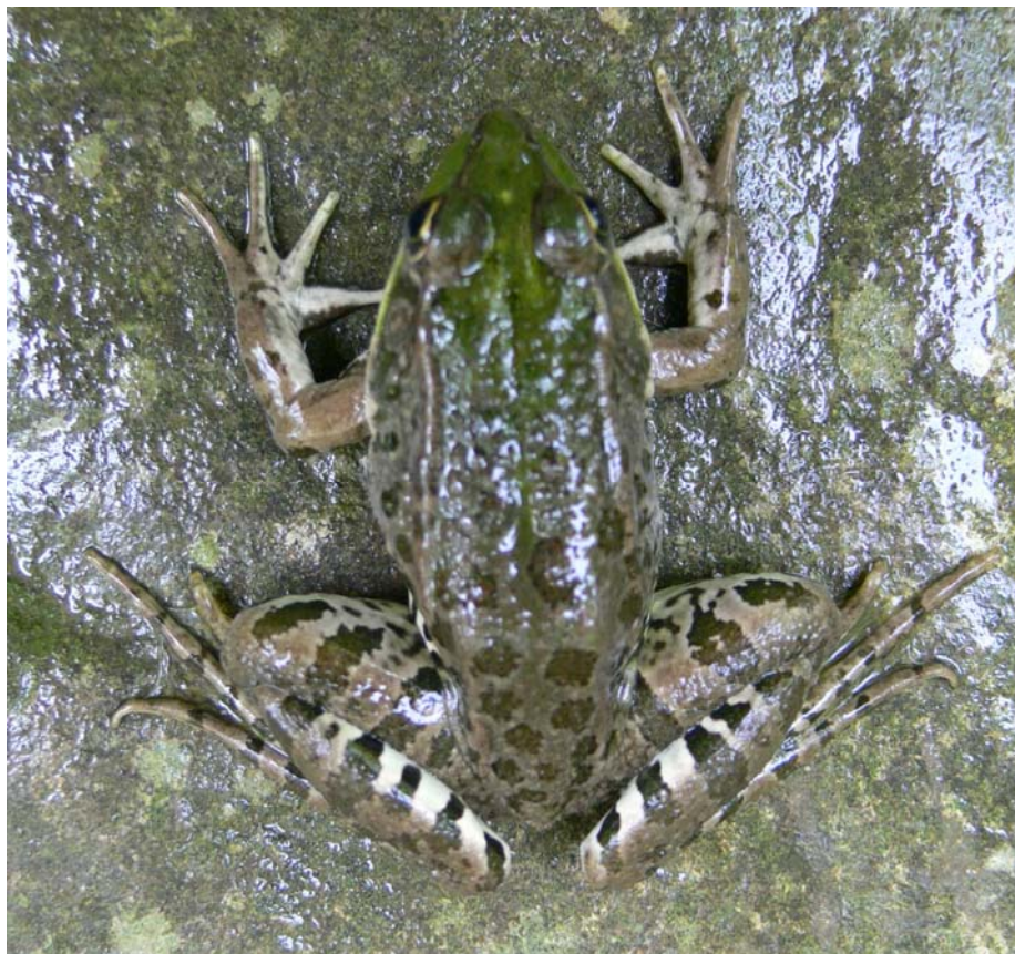
شکل ۲- ریخت یک قورباغه مردابی