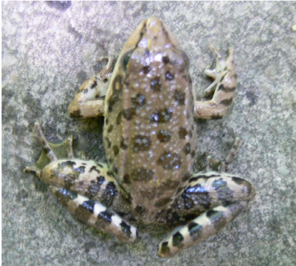
شکل ۳- ریخت دو قورباغه مردابی