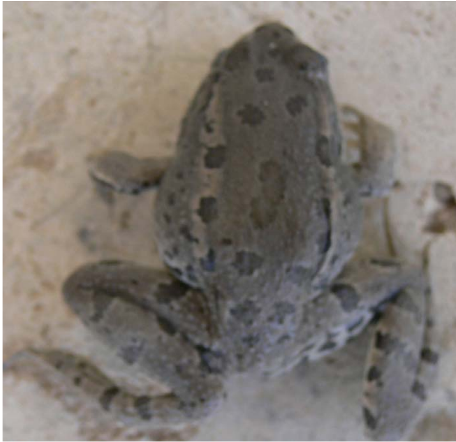
شکل ۸- ریخت هفت قورباغه مردابی

اگر |Z_{H_0}| > Z_{\frac{\alpha}{2}} در این آزمون با محاسبه Z_{H_0} به عدد 1/41 می‌رسیم ( Z_{H_0} = 1.41 ).