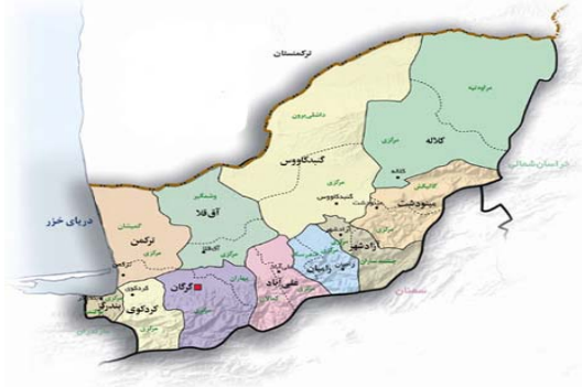
شکل ۱- نقشه استان گلستان

تاکنون چند ریختی رنگی توسط زیست شناسان مختلف با شیوه‌های مختلف و بر روی گونه‌های متعدد بررسی شده است به عنوان نمونه مطالعه چند ریختی رنگی در قورباغه مرغزار توسط V.G.Ishchenko (1994)، که چند ریختی را بر پایه سن قورباغه بررسی کرد و نشان داد که قورباغه‌ها با یک نوار پشتی در میان نمونه‌های پیرتر از شش سال نادر هستند، در حالی که قورباغه‌های بدون نوار پشتی در پیرترین گروه‌های سنی معمول‌تر هستند (۱۲). همچنین بر اساس مطالعات Dely (1964) و Ishchenko (1978)، چندین ریخت در جمعیت Rana arvalis گزارش شده است. آنها ریخت‌های دارای یک نوار پشتی روشن را "striata" و ریخت‌های دارای لکه‌های تیره در پشت را "maculata" و نمونه‌های را که لکه ندارند و نمونه‌های نقطه‌دار را تحت عنوان "punctata" نامید (۷ و ۱۱). ۲۵ گونه از دوزیستان بی دم معرفی شده‌اند که در آنها چند ریختی رنگی به صورت دو ریختی جنسی دیده می‌شود، وزغ Bufo periglenes می‌تواند یک مثال روشن برای توصیف دو ریختی جنسی در بی دمان ارائه دهد. در این گونه نرها نارنجی روشن و ماده‌ها زیتونی مخفی با لکه‌های قرمز یا سیاه هستند. متأسفانه این گونه احتمالاً منقرض شده است (۱۰). چندریختی رنگی قورباغه مردابی در ایران تاکنون مورد مطالعه قرار نگرفته بود، لذا در تحقیق حاضر مطالعاتی به منظور تعیین ریخت‌های مختلف این گونه در استان گلستان انجام شد.